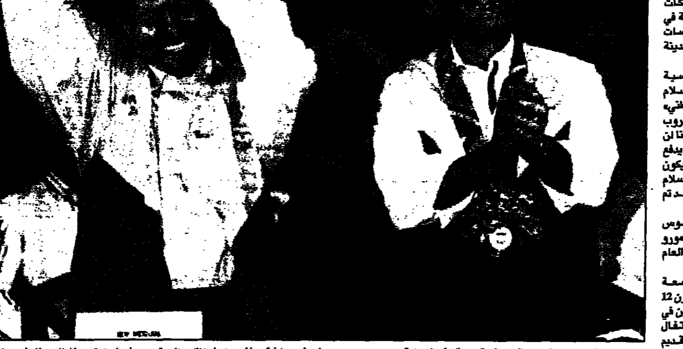
الرئيس الفلبيني فيدل راموس في زيارة له لجزيرة تحرير مورو نور ميسوري لى مشاركتها أمس في احتفال بمناسبة مرور عام على توقيعها اتفاق سلام

جولو (الفلبين) - أفاد راموس الرئيس الفلبيني في بيان صحفي أن مفاوضات السلام مع آخر مجموعة من الثوار المسلمين في جولو قد شهدت تقدما ملحوظا. وقال راموس، إن المفاوضات قد أنتجت اتفاقا مؤقتا يوقف إطلاق النار بين الطرفين. وأضاف أن الحكومة الفلبينية ستواصل العمل على تحقيق السلام الدائم في المنطقة.